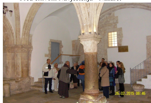
U dvorani Posljednje večere