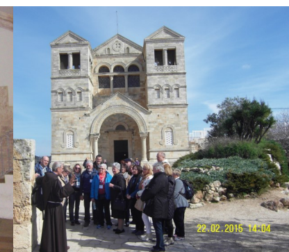
Na Taboru - Isusovo preobraženje