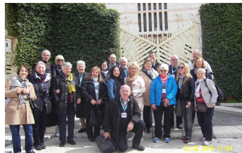
Pred crkvom Navještenja - Nazaret

8. DAN - Odlazak prema Kiryat Yearimu i zračnoj luci u Tel Avivu i povratak kući.