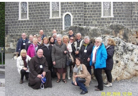
Pred crkvom Petrova primata