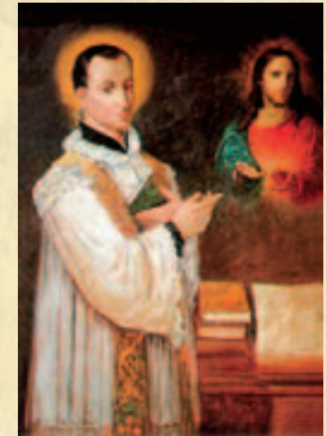
Sv. Klauđije La Colombière

Meditirajući o strpljivosti Isusa koji trpi, sv. Klauđije La Colombière je našao u Srcu Isusovu savršenu školu praštanja. O tome je zapisao: Neka Srce Isusa Krista bude naša škola!