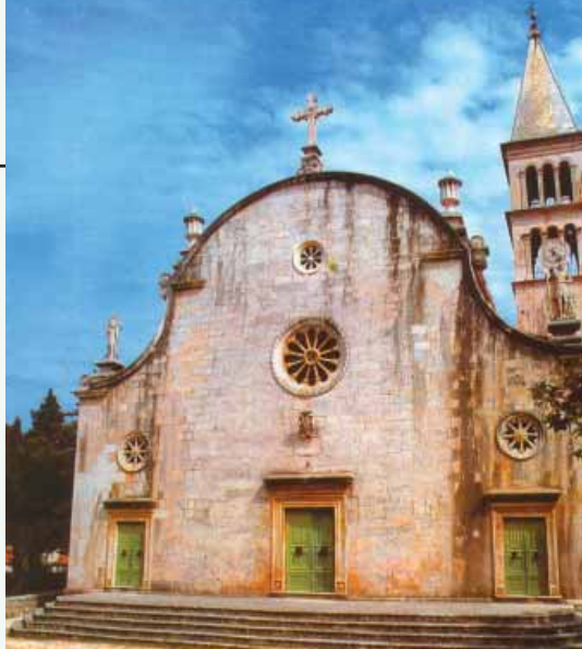
Župna crkva Gospe Karmelske u Nerežišćima na Braču

O privrženosti koju prvi kršćani iskazuju Mariji postoje mnogi dokazi: crkve, likovi, legende, hodočašća, pjesme i svečanosti. U najstarijoj katakombi, onoj Sv. Priscile, već od prve polovice II. stoljeća vidi se lik Marije s Djetetom Isusom. Mariji u pohvalu nastaju nenadmašiva djela koja su napisali sv. Irenej i Tertulijan. Makar mnoge legende povezane s Marijom Crkva nije u cijelosti preuzela kao vjerodostojne, ipak nam dokazuju Marijino štovanje. Njegovu daljnem razvitku pripada ustanovljenje marijanskih slavlja kojima se spominju pojedini događaji iz Marijina života. Premda su se prve crkve Mariji u čast pojavile u IV. stoljeću, već se prvi kršćani ukupljahu oko njezinih likova u katakombama.