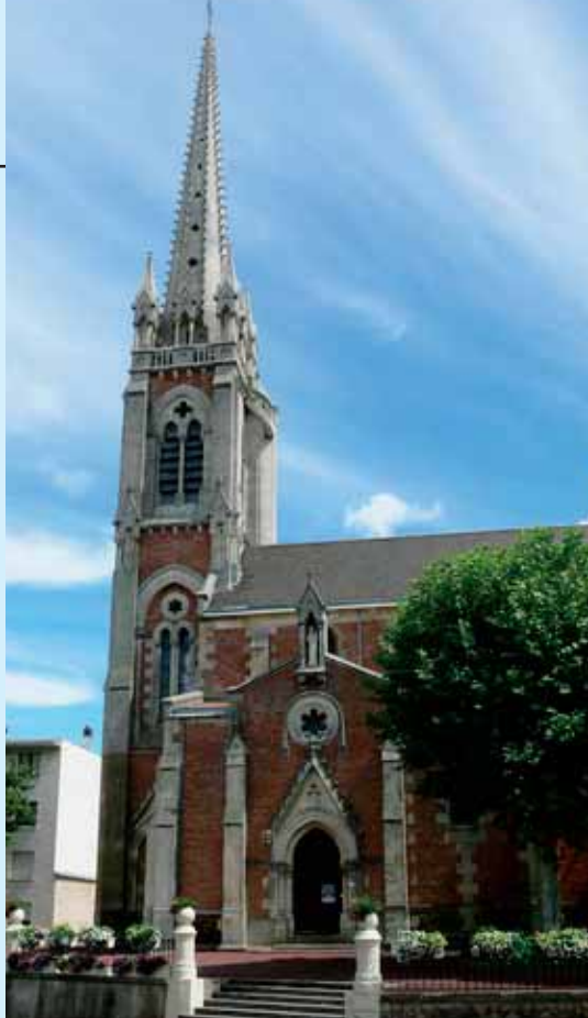
Gospino svetište u Arcachonu koje je fra Toma utemeljio (gore); fra Toma nalazi Gospin kip (desno)

Iako je fra Toma Ilirk bio jedan od najpoznatijih ljudi svoga vremena, u rodnom kraju je nepoznat. Rođen je oko g. 1465. u Vrani nedaleko od Zadra. Njegova obitelj pred Turcima se sklonila u Osimu kraj Ankone, s druge strane Jadrana. Ondje se upoznao s franjevcima i stupio u njihovu družbu "stroga opsluživanja". Obavljao je službu pučkog misionara i "vatreno" navješćivao riječ Božju diljem Italije, Francuske i Hrvatske. Iako je prokazivao mane vjernika i klera, mnoštvo ga je rado slušalo. Hodočastio je u Compostelu u Galiciji i u Svetu Zemlju. Među prvima je ustao protiv učenja Martina Luthera i napisao bogoslovske prouke u obranu katoličke vjere i rimskog biskupa. Oko g. 1518. nastanio se u Francuskoj, koju je upoznao na