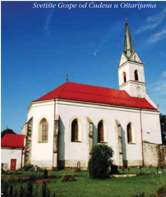
Svetište Gospe od Čudesa u Oštarijama