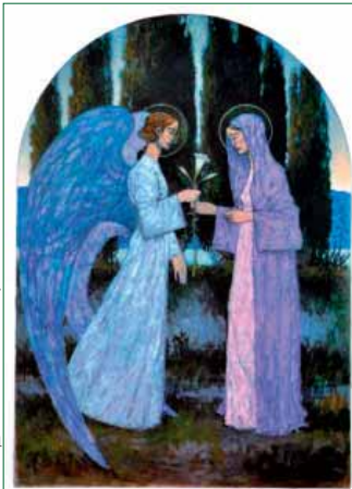
FRANE PERUZOVIĆ KRŠĆANSKA ERA I ISUSOVO UTJELOVLENJE

Nastojeći utvrditi godine i dane najvažnijih događaja iz Isusova života (začeće, rođenje i smrt) htio sam pokazati kako su ti događaji povezani s posvetama Hrama i okončanjima triju sužanjstava - egipatskoga, babilonskog i Antiohova. Isus je začet i umro na godišnjicu posvete Hrama koja je bila za Pashu nakon povratka Židova iz babilonskog sužanjstva. Pasha se svetkuje