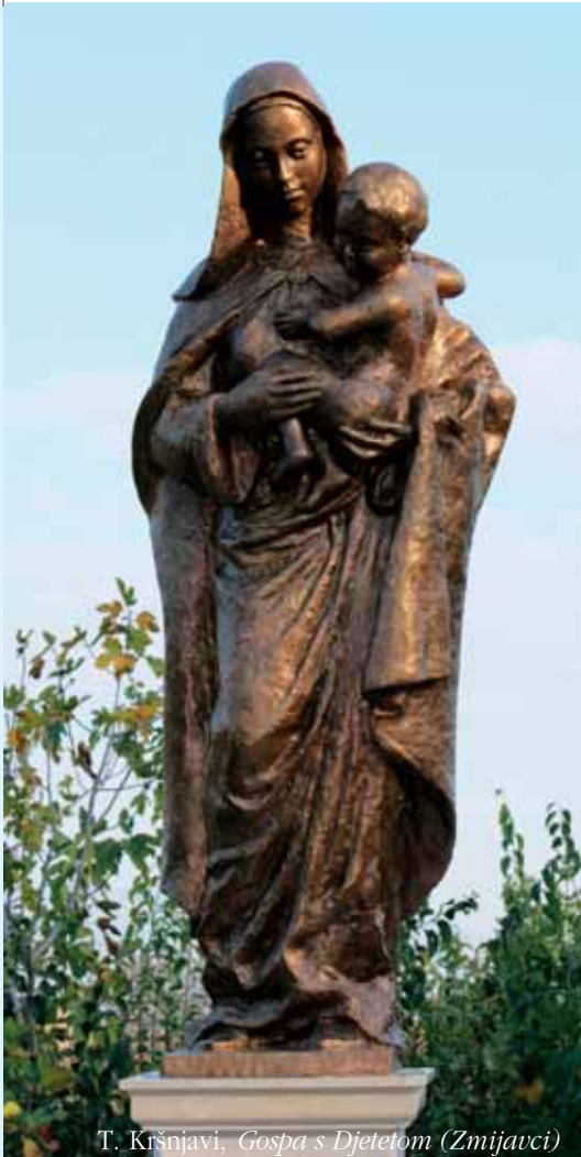
T. Kršnjavi, Gospa s Djetetom (Zmijavci)

mudrovati. Hitro ćemo pospremiti stan kako bi sve bilo na svom mjestu, čisto i uredno. Učinit ćemo sve kako bi se naš gost kod nas mogao osjećati ugodno. S nestrpljenjem ćemo brojiti minute kad će pozvoniti na naša vrata. Konačno, kad stigne, nastojat ćemo da dulje ostanemo jer su naši razgovori puni topline, iskrenosti i slobode. Toliko toga imamo podijeliti s pravim prijateljem i taj nas susret čini sretnima. Zar se ne bi tako trebalo pripremiti za susret s Isusom?!