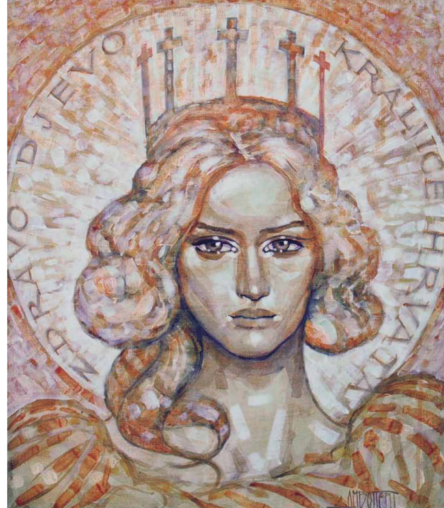
Izložba likovnih radova u prigodi 50 godina vjerskoga lista za Marijine štovatelje MARIJA Pinakoteka Franjevačkoga samostana Gospe od Zdravlja Split Dobri, 1. – 15. XII. 2012.