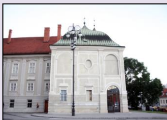
Muzej Blaženog Alojzija Stepinca u Zagrebu

Autor je nekoliko knjiga . Jedan je od vodećih poznavatelja u Velikoj Britaniji za geopolitički položaj Hrvatske. Angažiran je kao stručnjak za transatlantske odnose u američkoj zakladi Heritage u Washingtonu DC.